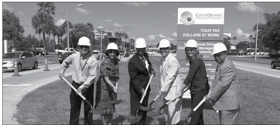
Orlando Mayor Buddy Dyer and other officials break ground on North International Drive Improvement Project.

The $9.2 million improvement project consists of rehabilitating the roadway and addressing safety and capacity needs for all travel modes. The project will improve the appearance of the area and enhance the economic competitiveness of North International Drive. The project is being completed using $5.17 million in Federal Surface Transportation Funds along with Transportation Impact Fees generated from development in the southwest part of the City of Orlando.